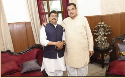
नई दिल्ली. शाबाश इंडिया