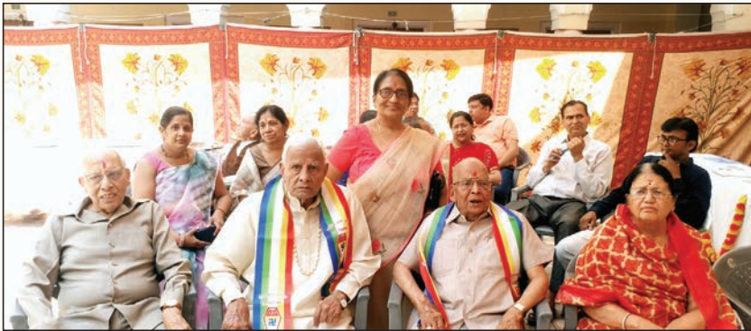
जयपुर. शाबाश इंडिया