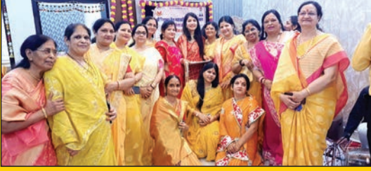
अजमेर. शाबाश इंडिया

भगवान के पांच नाम वर्धमान, वीर, अतिवीर, सन्मति एवम महावीर के भजनों पर भक्त भाव विभोर हुए