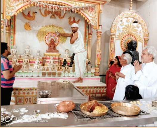
फागी. शाबाश इंडिया