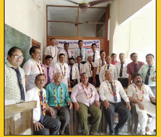
कुचामन. शाबाश इंडिया

गोयल अध्यक्ष, पहाड़िया सचिव, जैन कोषाध्यक्ष बने