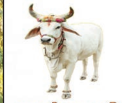
जय गौ माता की

जयपुर. कासं। भाजपा मुख्यालय पर 12 मार्च को प्रदेश पदाधिकारियों की अहम बैठक होने जा रही है। इस बैठक में पार्टी की ओर से आगामी दिनों में किए जाने वाले कार्यों की रूपरेखा के साथ ही चुनाव तैयारियों को लेकर भी चर्चा होगी। बैठक में प्रभारी अरुण सिंह भी शामिल हो सकते हैं। पार्टी सूत्रों की मानें तो इस साल के अंत में चुनाव होने हैं। इसके मद्देनजर प्रदेश की गहलोट सरकार को जनविरोधी मुद्दों पर घेरने के लिए कुछ ही समय बचा है। बैठक में सरकार को घेरने की रणनीति बनाई जाएगी। साथ ही जिलों में 15 मार्च से शुरू होने वाले धरने-प्रदर्शनों पर भी बैठक में चर्चा की जाएगी। बैठक में पार्टी की ओर से पिछले दिनों किए गए आंदोलनों व अन्य कार्यक्रमों की समीक्षा भी की जाएगी। बैठक में मोदी सरकार की योजनाओं के प्रचार-प्रसार को लेकर भी चर्चा की जाएगी। साथ ही पन्ना प्रमुख, विस्तारक सहित कई कार्यक्रमों की समीक्षा भी की जाएगी।