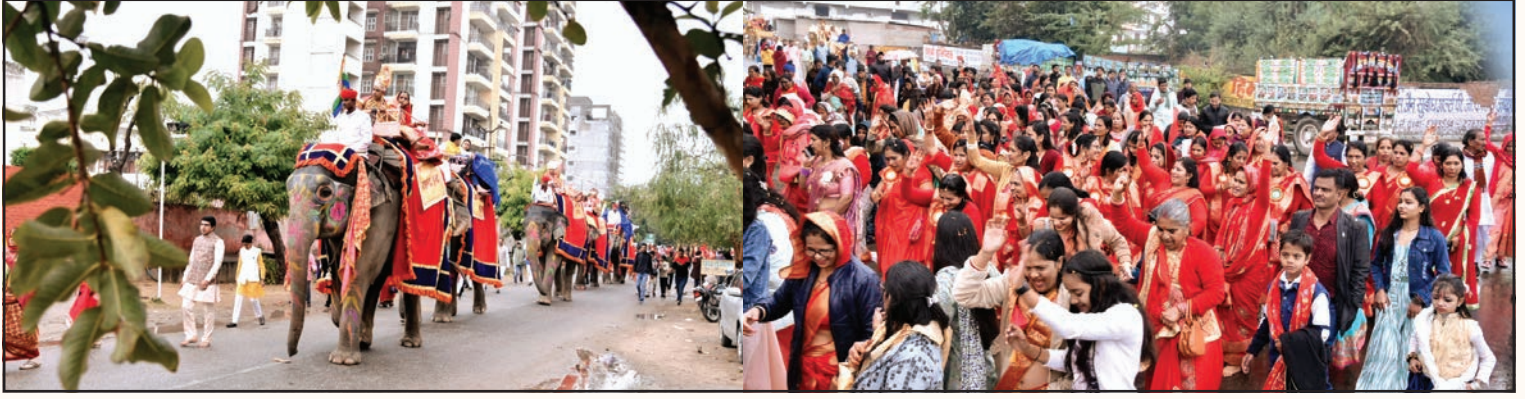
श्रीमज्जिनेंद्र शांतिनाथ जिनबिंब पंचकल्याणक प्रतिष्ठा महोत्सव एवं विश्व शांति महायज्ञ महोत्सव प्रताप नगर के तीसरे दिन