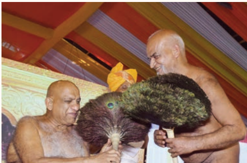
ललितपुर. शाबाश इंडिया