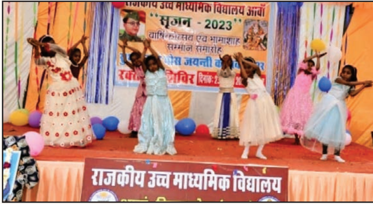
आवां. टोंक. शाबाश इंडिया