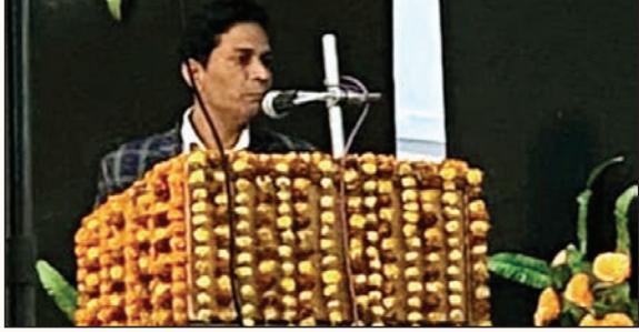
बीकानेर. शाबाश इंडिया