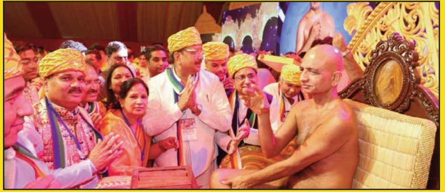
सम्मदे शिखर जी, शाबाश इंडिया