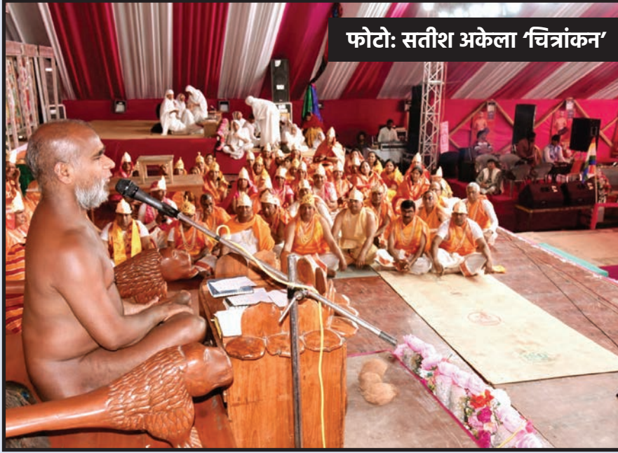
फोटो: सतीश अकेला 'चित्रांकन'