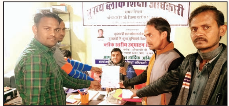
श्री महावीरजी. शाबाश इंडिया