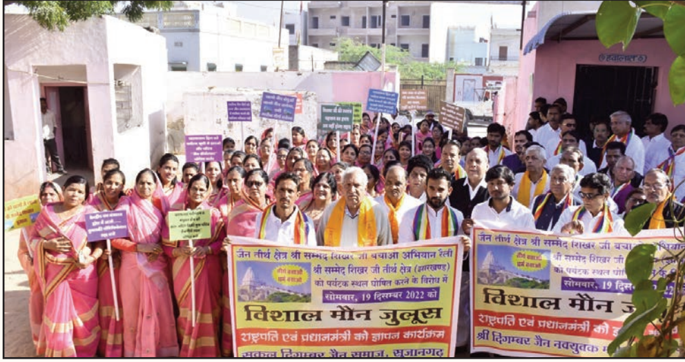
सुजानगढ़, शाबाश इंडिया

जैन धर्म की आन बान शान का प्रतीक श्री तीर्थराज श्री सम्मेद