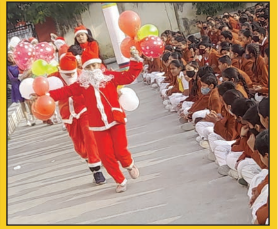
जयपुर. शाबाश इंडिया

महावीर पब्लिक स्कूल के कक्षा 1 से 5 के छात्रों ने बड़ी ही धूमधाम से क्रिसमस का उत्सव मनाया। चारों ओर रंग-बिरंगी पोशाकें पहने हुए जोश और उत्साह से युक्त बच्चों ने भगवान यीशु मसीह के दृश्य को खूबसूरती से चित्रित किया और सभी दर्शकों को क्रिसमस