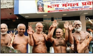
गया. शाबाश इंडिया

दिगम्बर जैन संतों का वात्सल्यमय भव्य अनुठा महामिलन का महा संगम