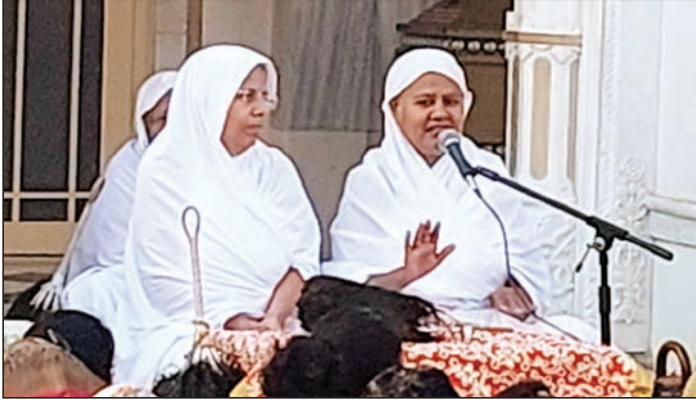
करौली. शाबाश इंडिया