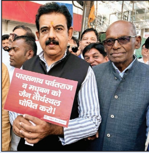
इंदौर. शाबाश इंडिया

समग्र जैन समाज के सर्वोच्च पवित्र तीर्थ और 20 तीर्थकरों की निर्माण स्थली सम्मेलित शिखर जी को झारखंड सरकार द्वारा पर्यटन, पिकनिक स्पॉट, एवं पर्वतारोहण और आमोद प्रमोद का केंद्र बनाने के निर्णय के विरोध में आज विश्व जैन संगठन दिल्ली के आवाहन पर देशभर में मौन रैली निकालकर ज्ञापन दिए गए। इंदौर में भी सद्भावना परमार्थिक न्यास के नेतृत्व में प्रातः राजवाड़े से गांधी प्रतिमा रीगल चौराहे तक समग्र जैन समाज की