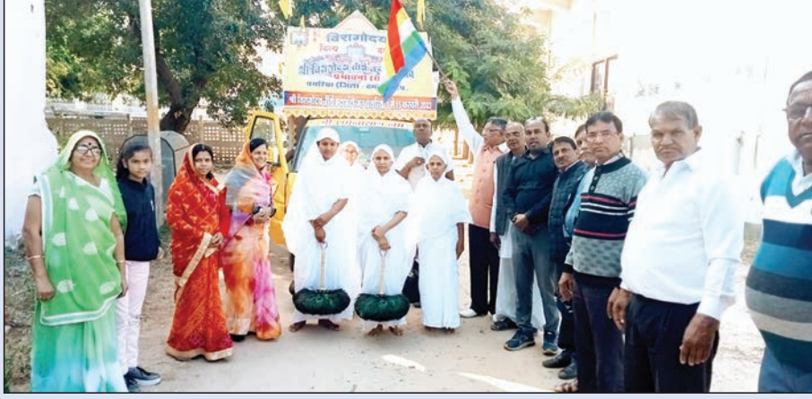
निवाड़. शाबाश इंडिया