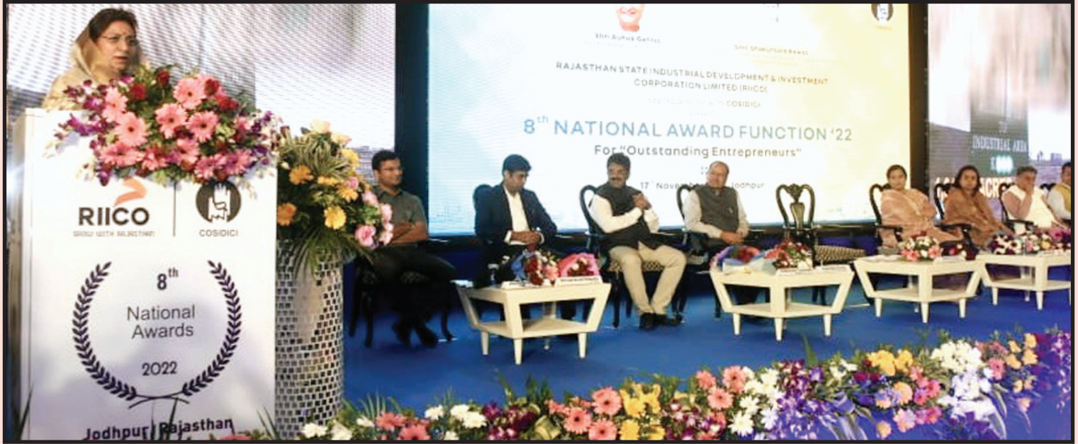
राष्ट्रीय कोसीडीसी अवार्ड्स-2022

प्लॉट नंबर 8, ओझा जी का बाग, गांधी नगर मोड़, टोंक रोड, जयपुर