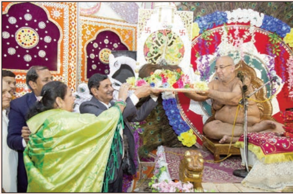
रेवाड़ी. शाबाश इंडिया