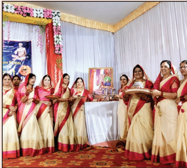
मुंगावली. शाबाश इंडिया