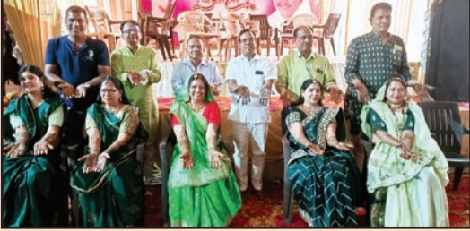
निवाड़ी, शाबाश इंडिया

ध्वजारोहण के साथ 31 को होगा विधान का शुभारंभ